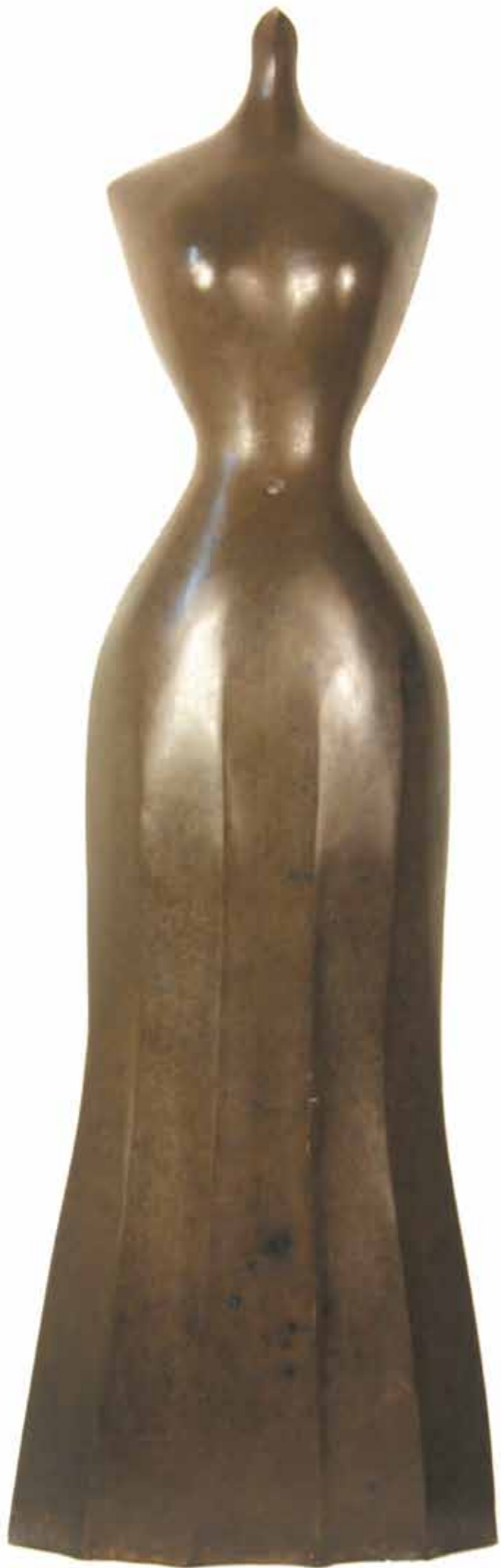
Figura femminile bronze hauteur 78 cm