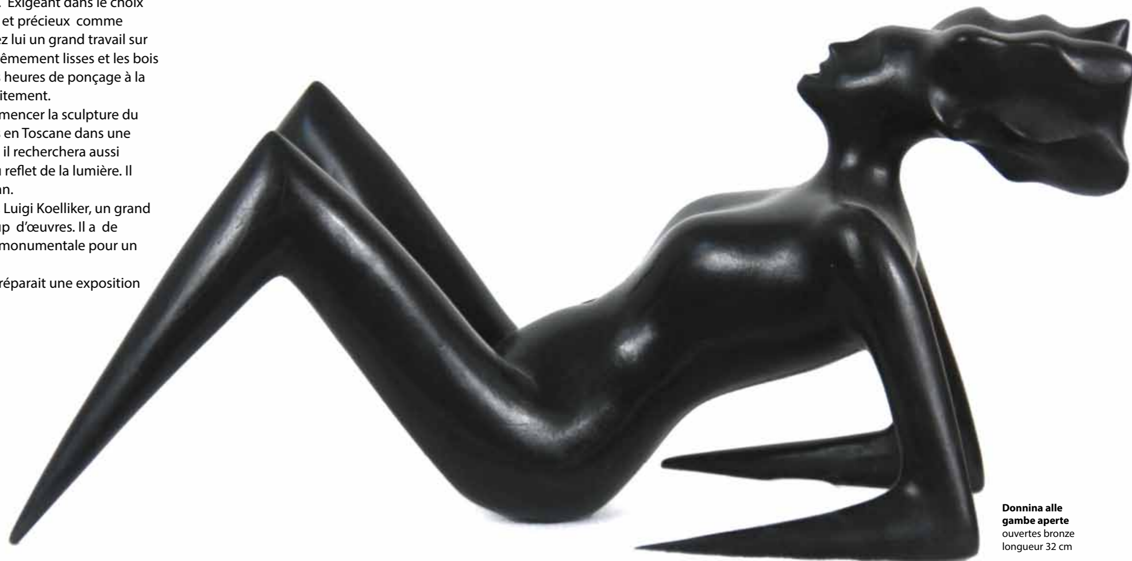
Donnina alle gambe aperte ouvertes bronze longueur 32 cm