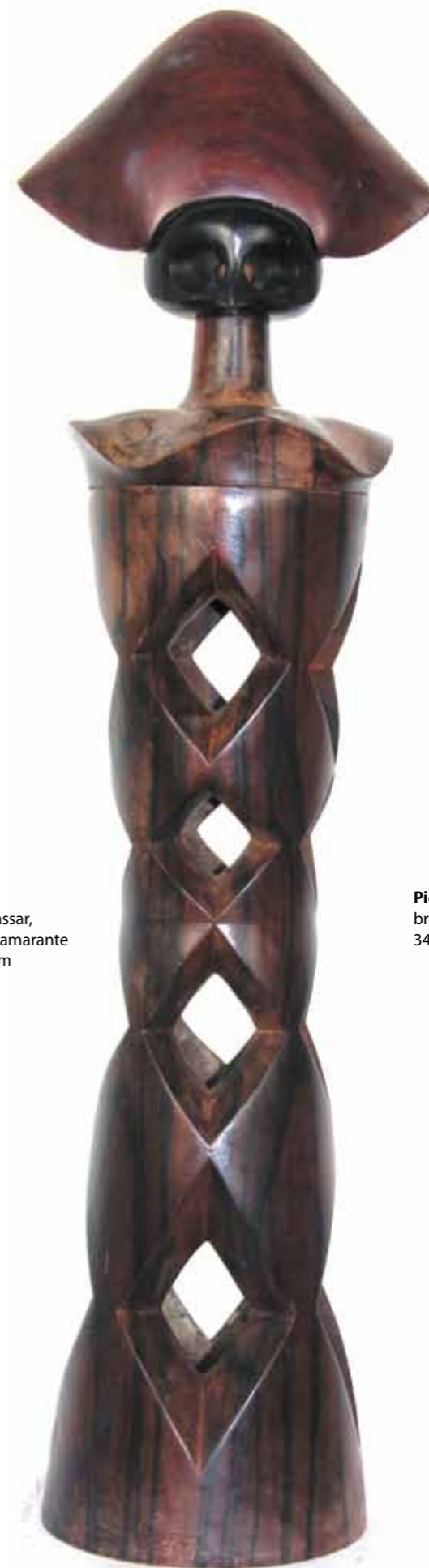
Arlecchino bois de macassar, d'ébène et d'amarante hauteur 70 cm