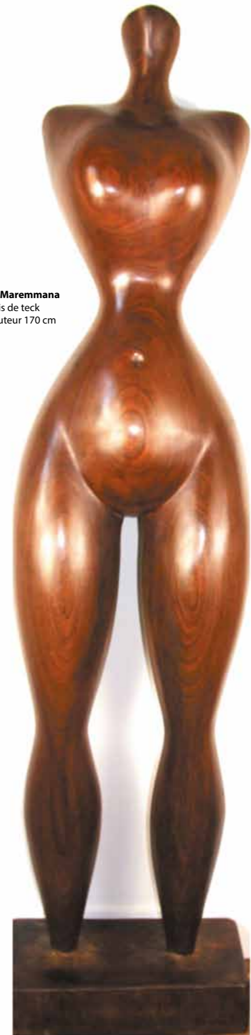
La Maremmana bois de teck hauteur 170 cm