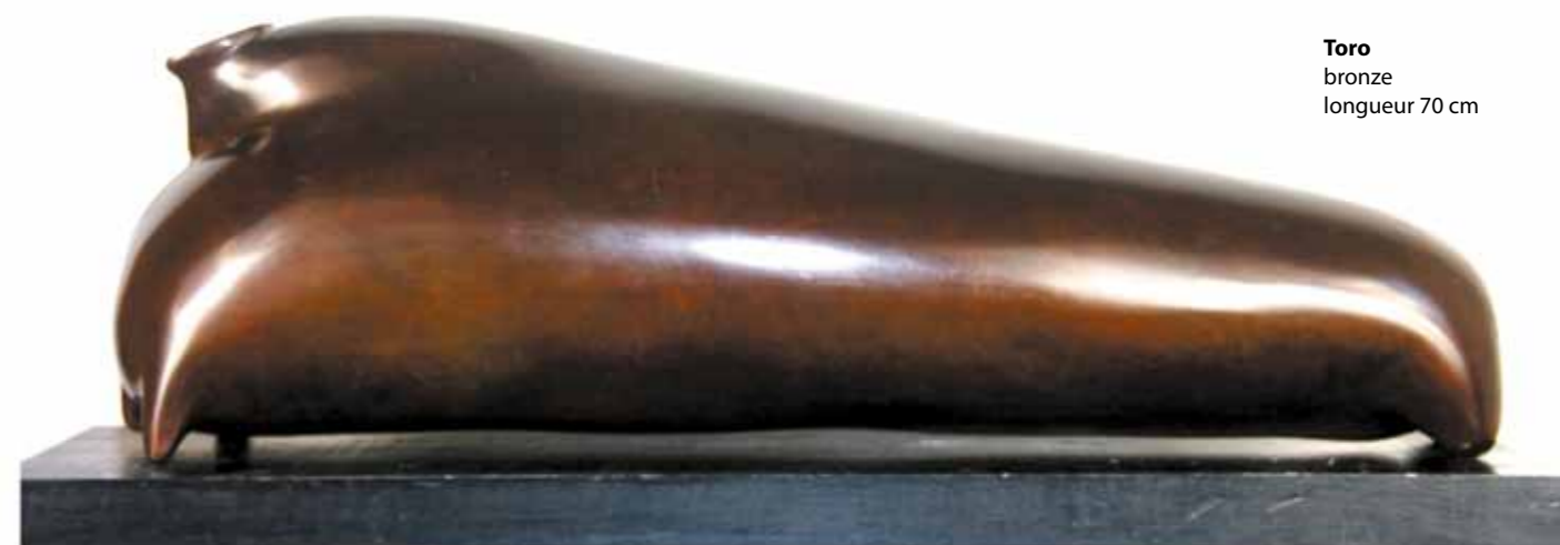
Toro bronze longueur 70 cm