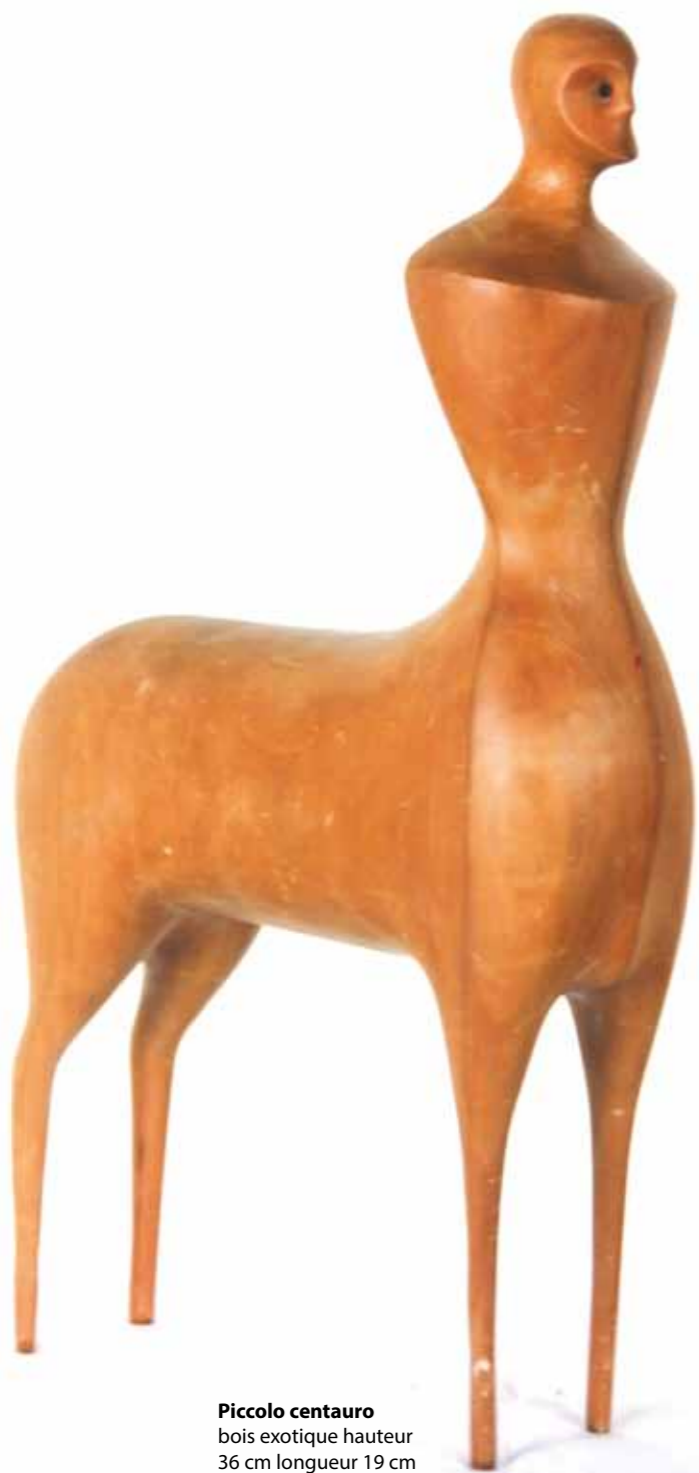
Piccolo centauro bois exotique hauteur 36 cm longueur 19 cm

La matière doit être pour lui nettement transfigurée. Elle doit apparaître différente par rapport à l'immédiate perception.