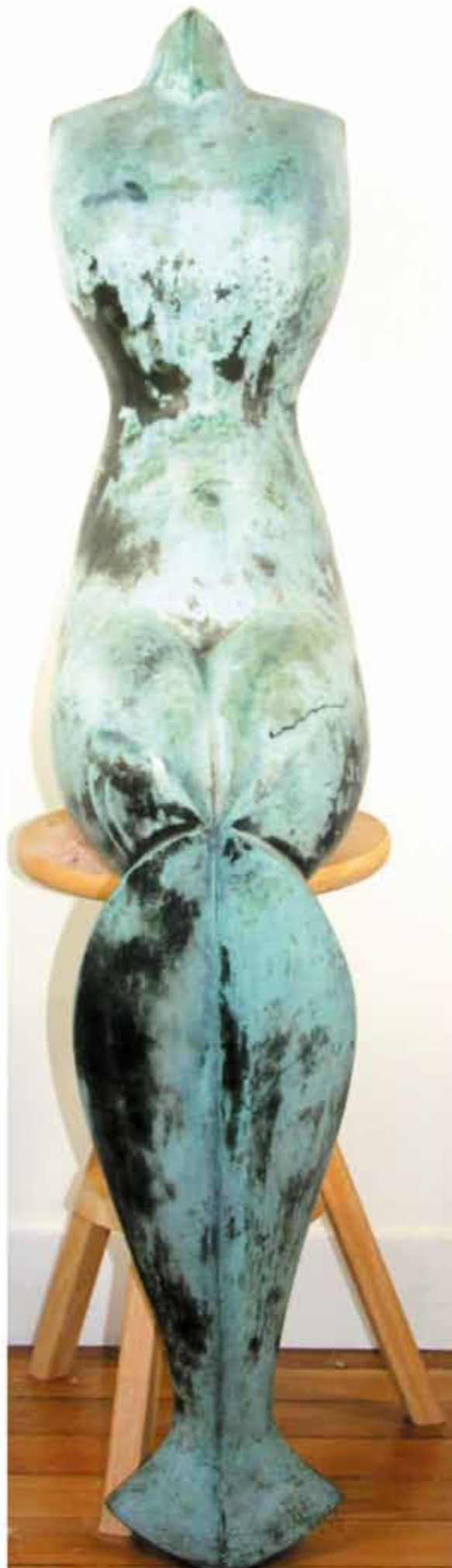
Sirena bronze oxydé hauteur 130 cm