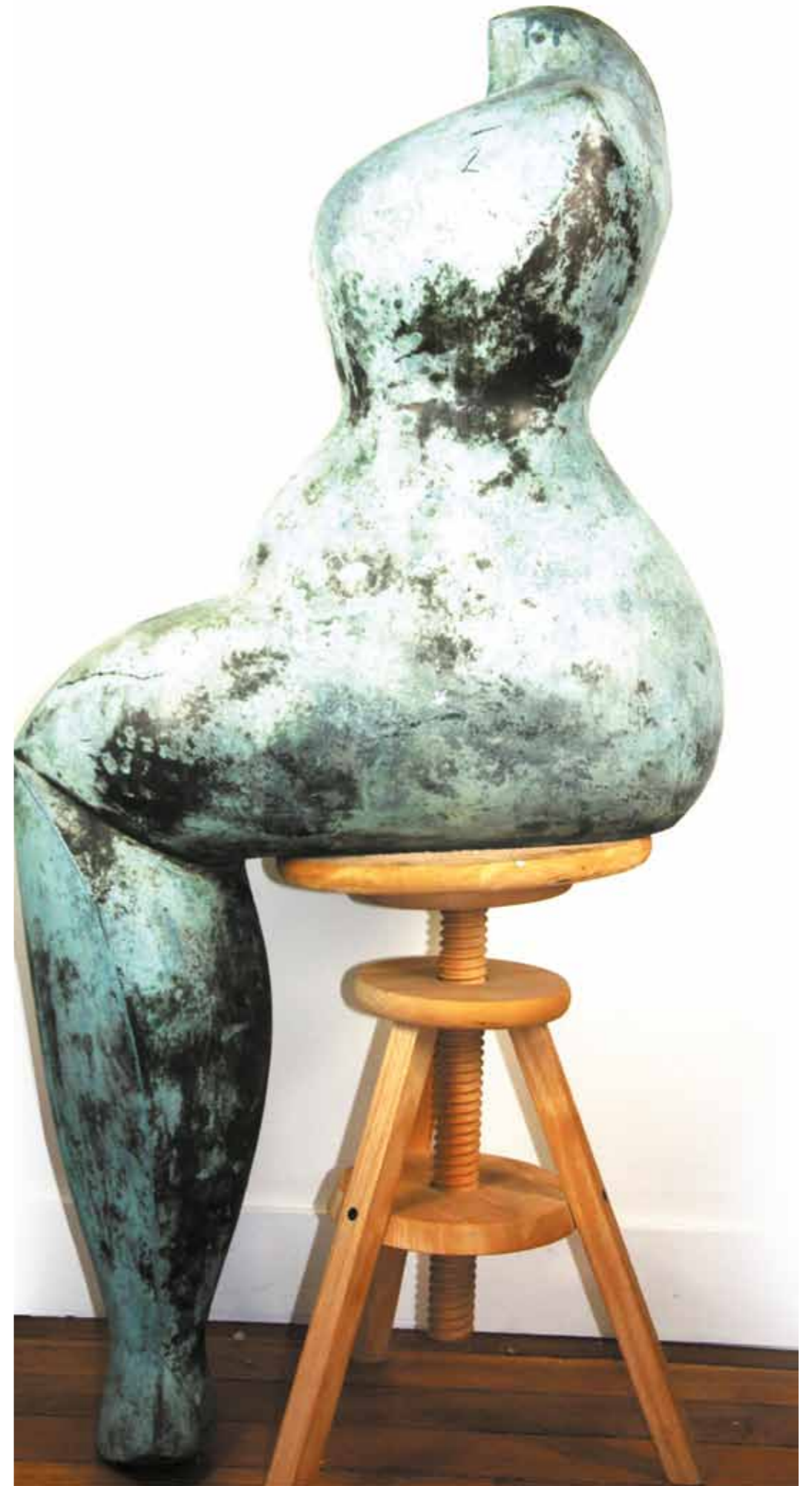
Sirena bronze oxydé hauteur 130 cm