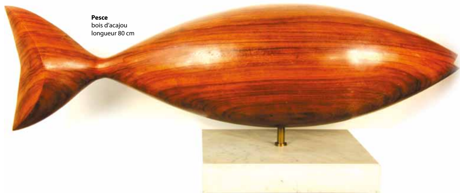
Pesce bois d'acajou longueur 80 cm