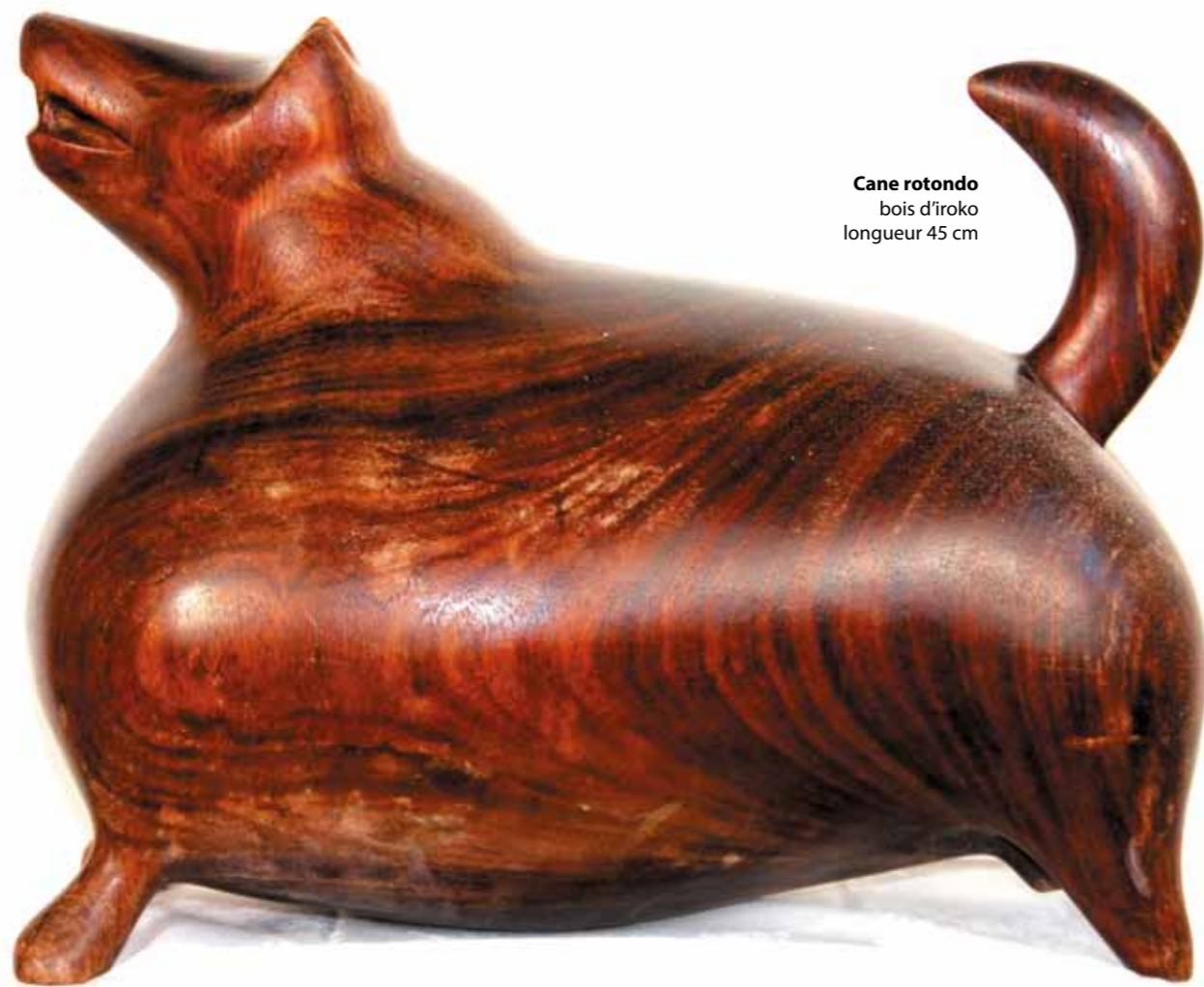
Cane rotondo bois d'iroko longueur 45 cm