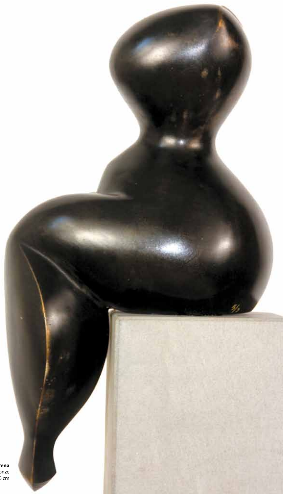
Sirena bronze hauteur 46 cm