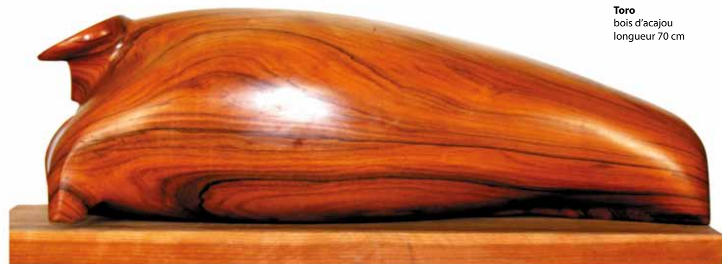
Toro bois d'acajou longueur 70 cm