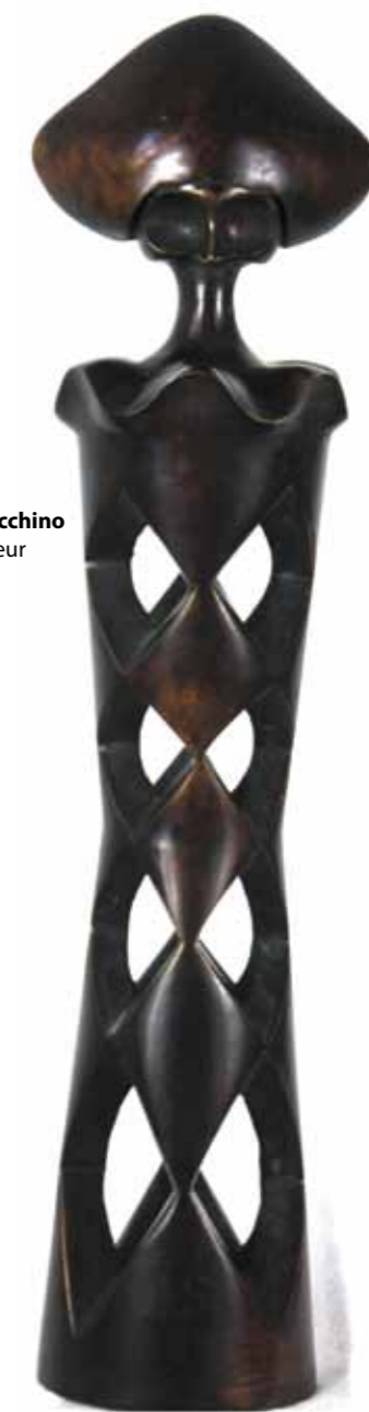
Piccolo Arlecchino bronze hauteur 34 cm