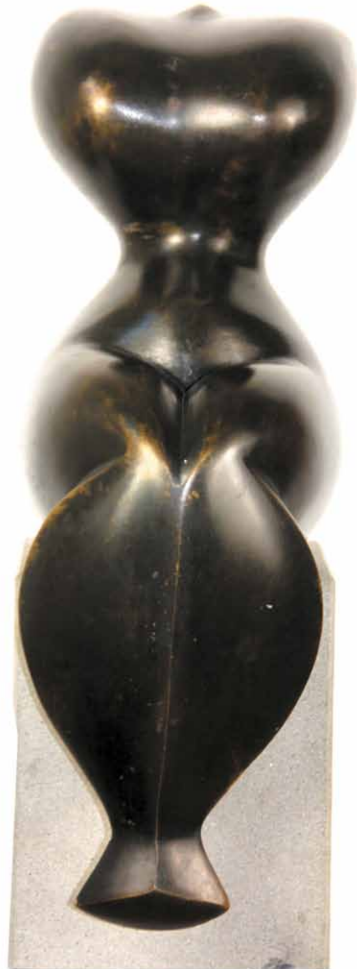
Sirena bronze hauteur 46 cm