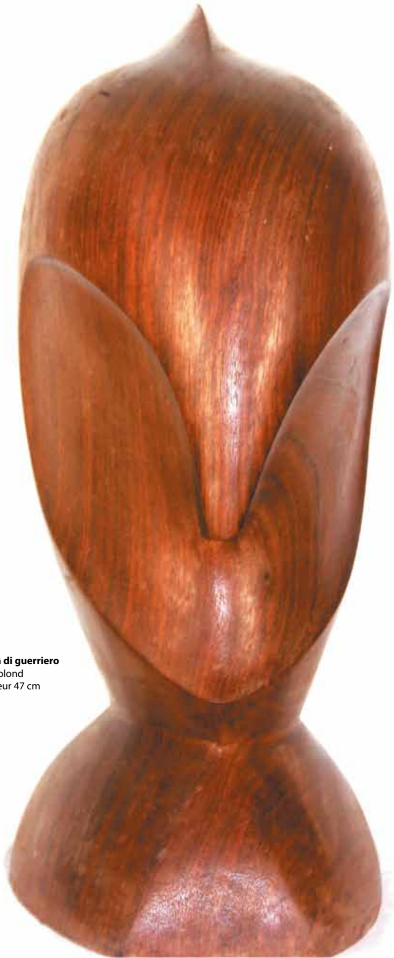
Testa di guerriero bois blond hauteur 47 cm