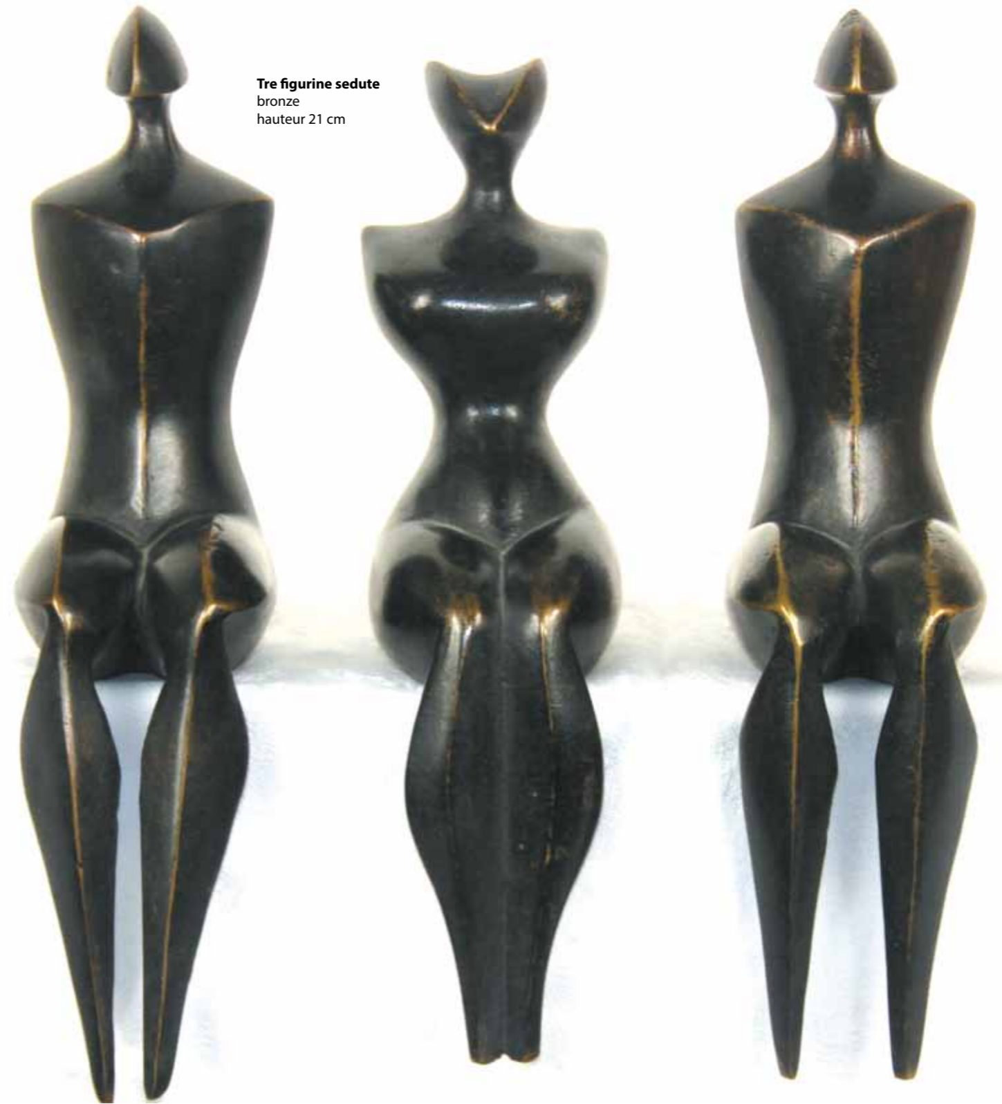
Tre figurine sedute bronze hauteur 21 cm