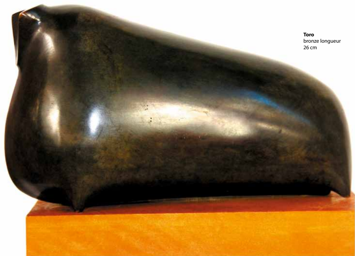
Toro bronze longueur 26 cm