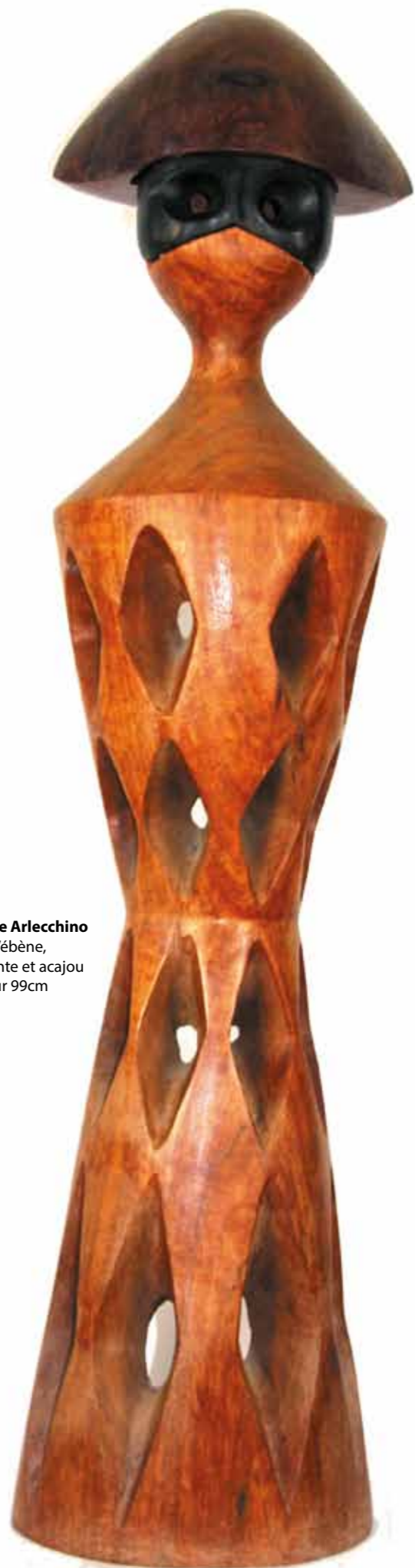
Grande Arlecchino bois, d'ébène, amarante et acajou hauteur 99cm