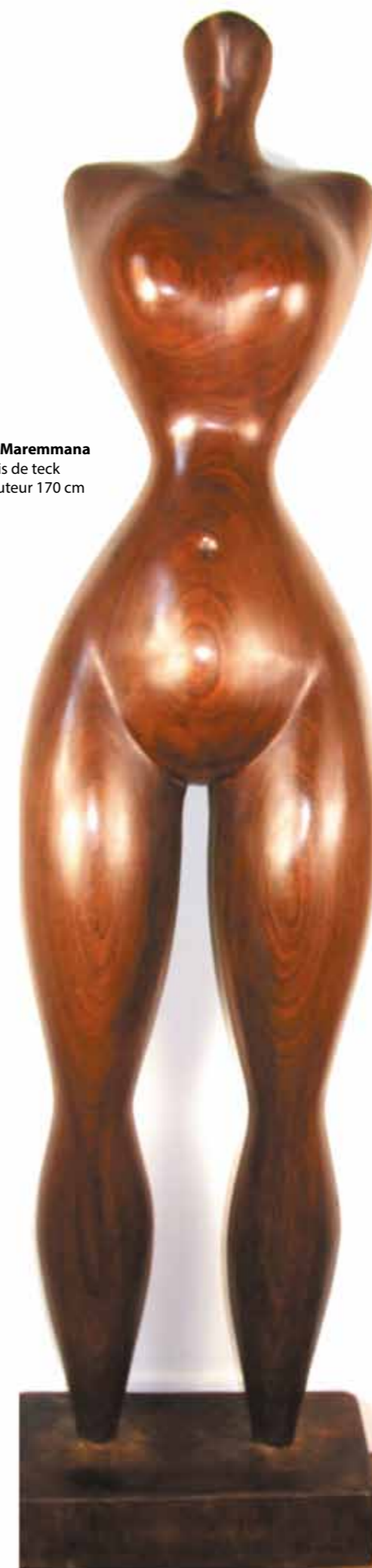
La Maremmana bois de teck hauteur 170 cm