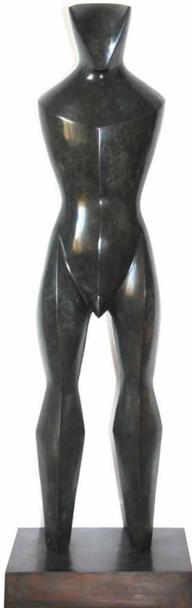
Minotaurio bronze hauteur 103cm