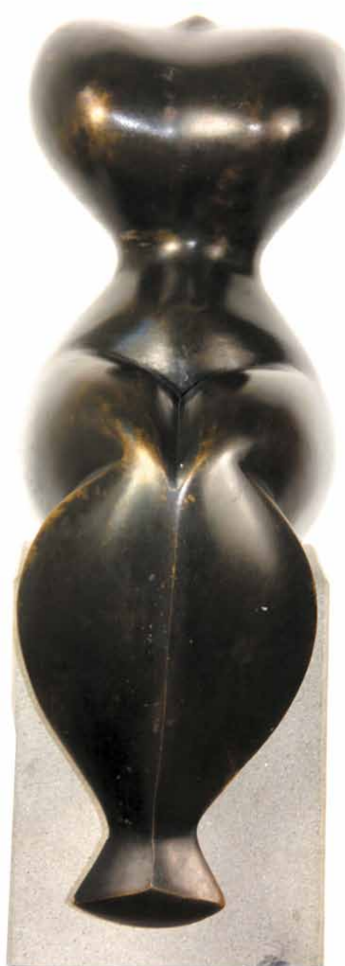
Sirena bronze hauteur 46 cm