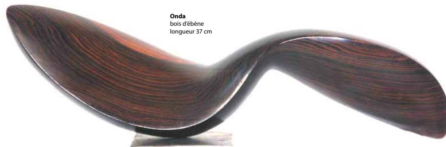
Onda bois d'ébène longueur 37 cm