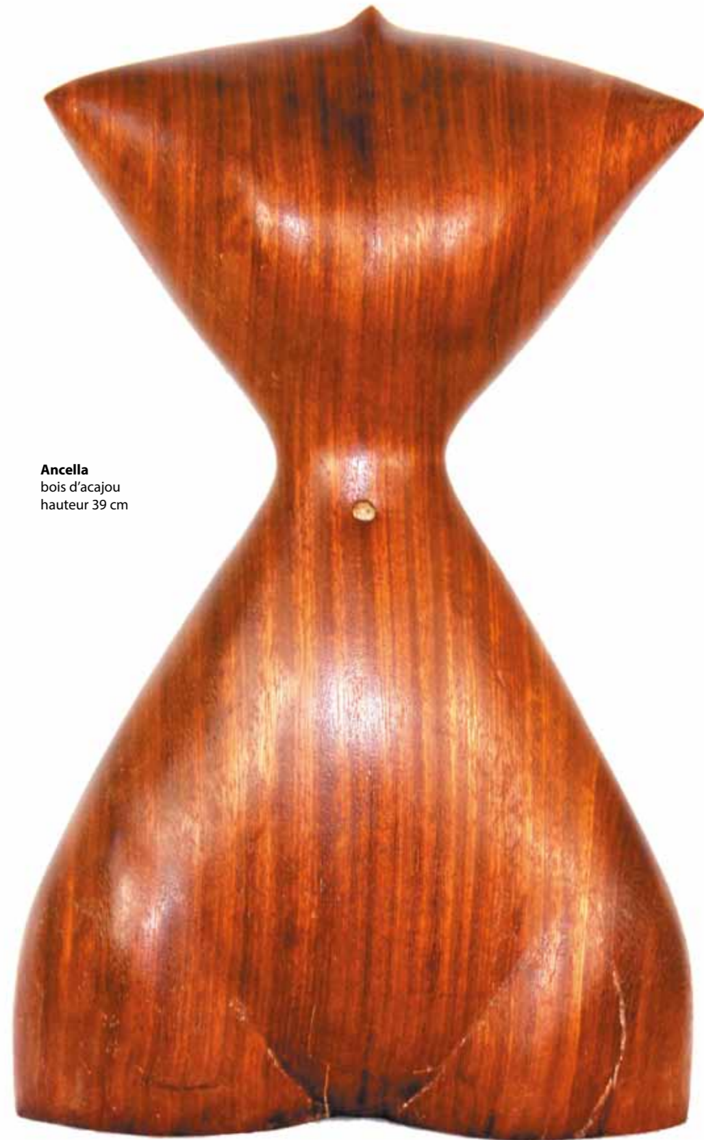
Ancella bois d'acajou hauteur 39 cm