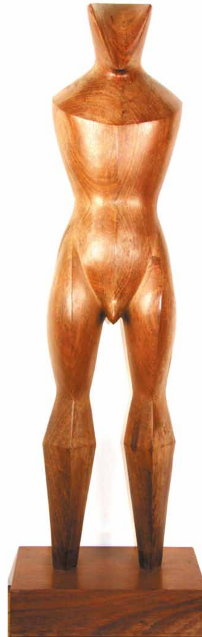
Minotaurio bois d'iroko hauteur 103cm

Toutes les sculptures en bois sont les originaux à partir desquels sont tirés les bronzes, ils ne sont donc pas destinés à la vente.