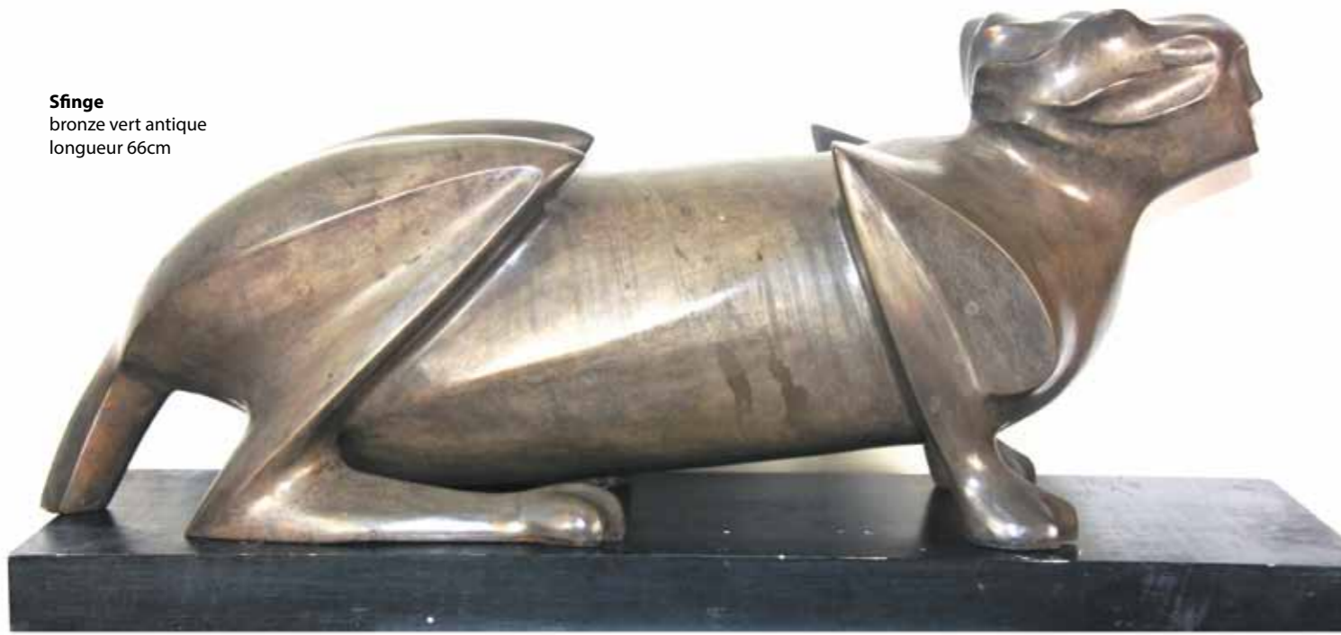
Sfinge bronze vert antique longueur 66cm