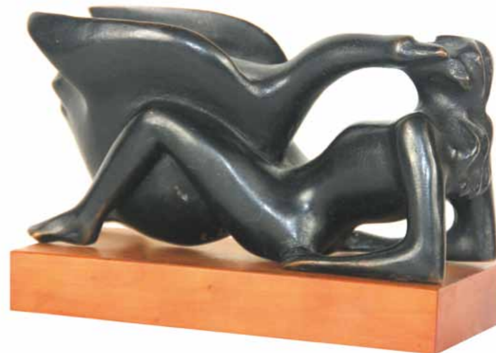
Piccolo centauro bois exotique hauteur 36 cm longueur 19 cm