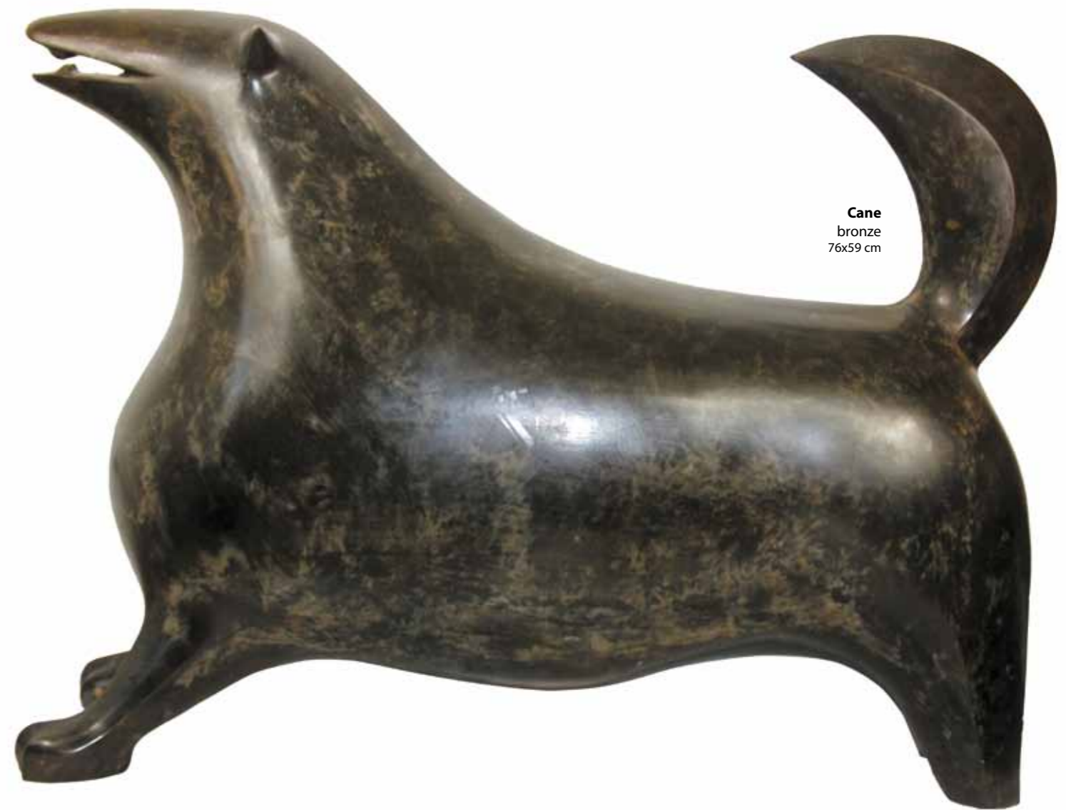
Cane bronze 76x59 cm