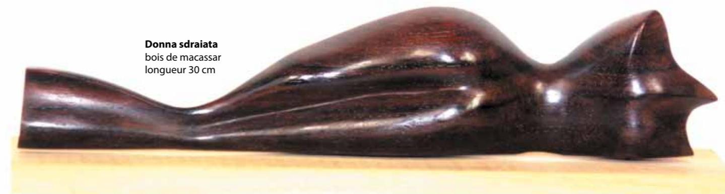
Donna sdraiata bois de macassar longueur 30 cm