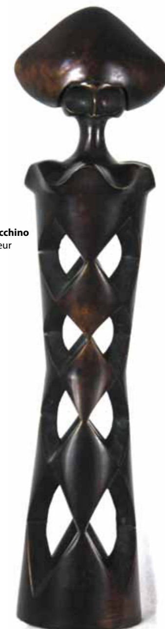
Piccolo Arlecchino bronze hauteur 34 cm