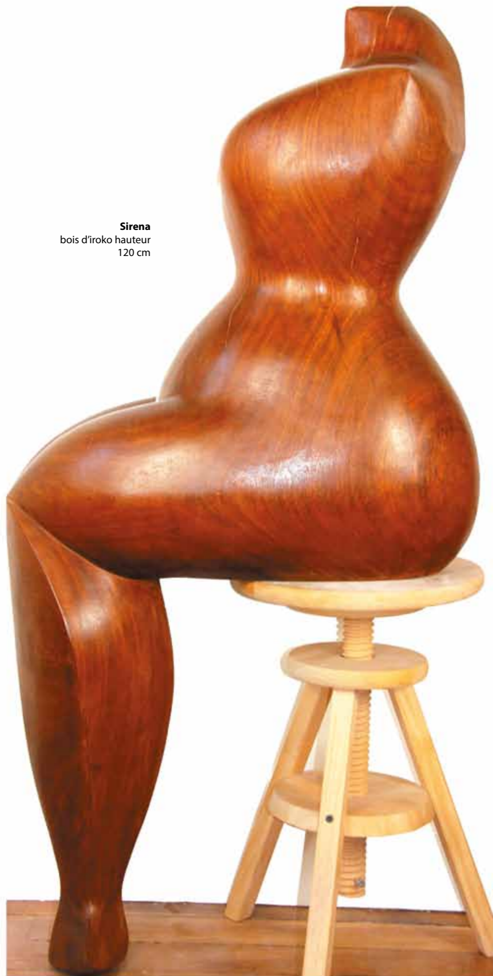
Sirena bois d'iroko hauteur 120 cm