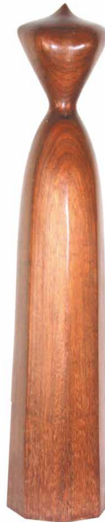
Figura di donna bois exotique hauteur 58 cm